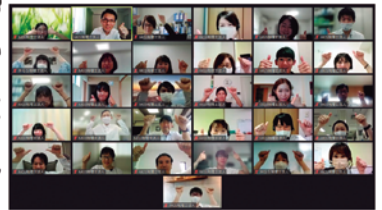
オンライン全体会議風景