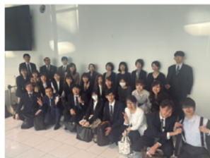
創立記念式典・入社式