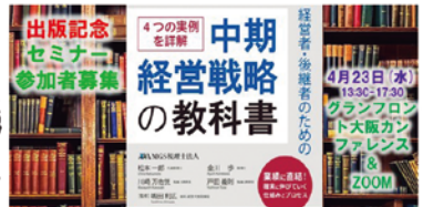
経営支援セミナー